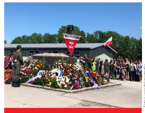
Gedenk- und Befreiungsfeier in der KZ-Gedenkstätte Mauthausen

Das Jahr 2018 steht im Zeichen zahlreicher Gedenk- und Jahrestage. Die Erinnerung an das Jahr 1938 wird heuer mit vielen Veranstaltungen ganz besonders wach gehalten. So wurde am 4. Mai im Zeremoniensaal der Hofburg in einer Gedenkveranstaltung anlässlich des Gedenktages gegen Gewalt und Rassismus der Opfer des Nationalsozialismus gedacht. Am 6. Mai nahmen zahlreiche Abgeordnete anlässlich der 73. Wiederkehr der Befreiung des KZ Mauthausen an einer internationalen Gedenk- und Befreiungsfeier in der KZ-Gedenkstätte Mauthausen teil.